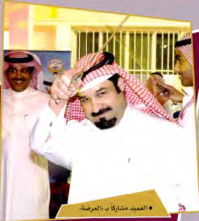
• العميد مشاركا في العرضة