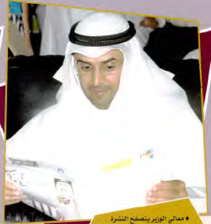
• معالي الوزير يتصفح النشرة