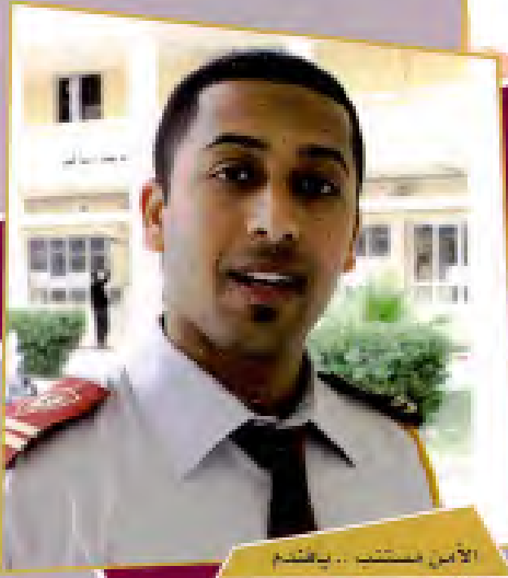
• الأمن مستتب .. يا فتيم