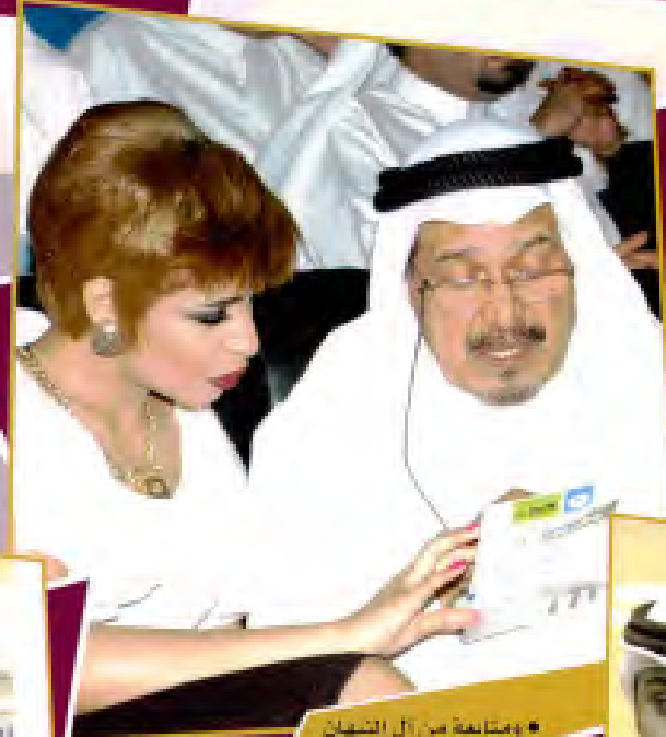
• ومتابعة من آل الشهبان